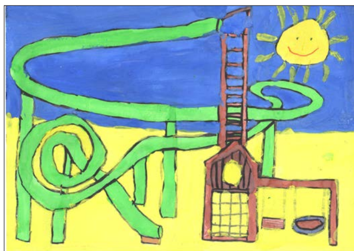
První dětské hřiště v Krhové