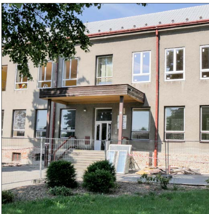
Budova ZŠ před energetickým opatřením