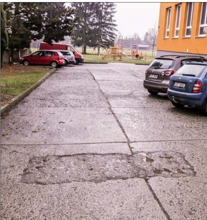
rekonstrukce zpevněných ploch před