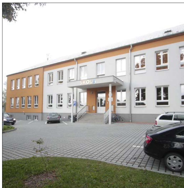
Budova ZŠ po energetickém opatření