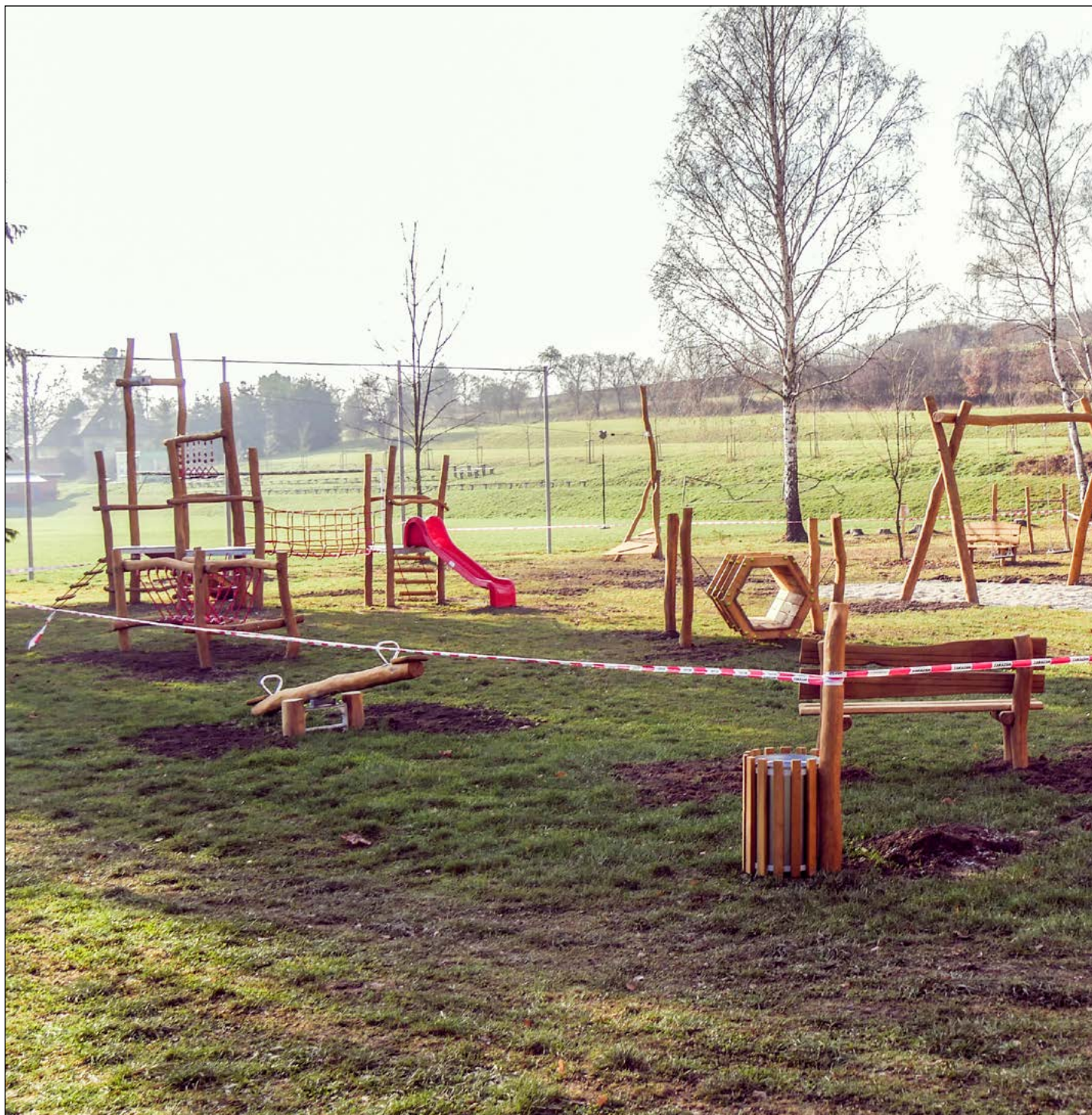
První dětské hřiště v Krhové