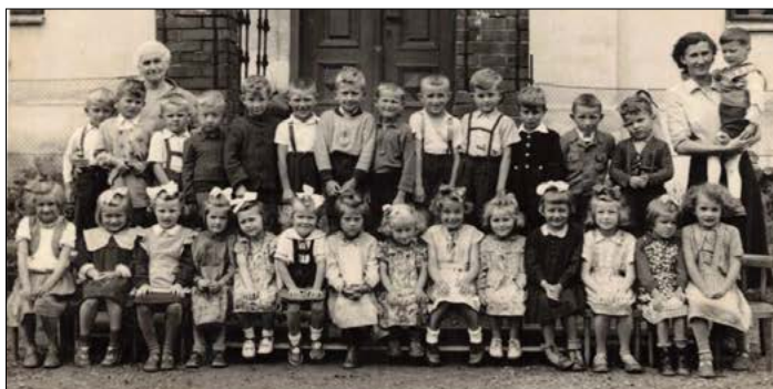
Mateřská škola rok 1953 s učitelkami před dolní školou

Od 16. 2. 1948 byla otevřena v obci mateřská škola. Umístěna byla v budově dolní školy, kde bylo umožněno využít zařízení žňového útulku. Aby tato škola mohla dobře plnit své poslání, bylo nutné přesvědčit rodiče dětí předškolního věku o významu výchovy předškolní mládeže. Dle zápisu v kronice se rodičům příliš nezamlouvalo dávat děti do školky.