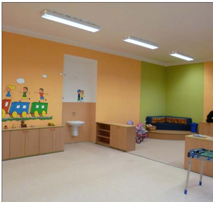
ZŠ - nová školní družina