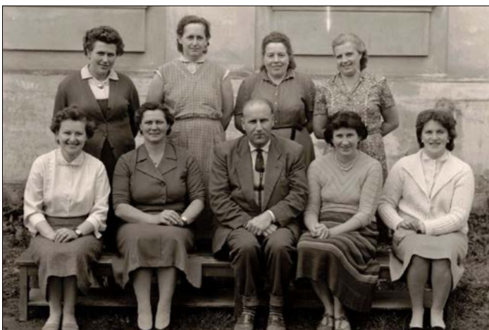
Zaměstnanci školy 1961