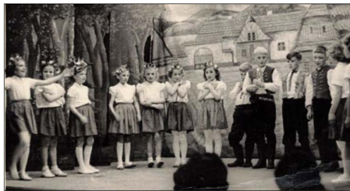
divadlo Kinkáš Martinko

Od roku 1989 prošla škola také několika obdobími, nejprve fungovala jako samostatná pod řízením Školského úřadu ve Vsetíně, později od roku 1996 jako odloučené pracoviště ZŠ Masarykova Valašské Meziříčí a nyní již 10 let po odtržení obce pracuje samostatně. O současnosti podrobněji psát nebudeme, škola se pravidelně prezentuje v Krhovském zpravodaji a na svých webových stránkách, chtěli jsme se zaměřit zejména na minulost a připomenout si některé důležité události.