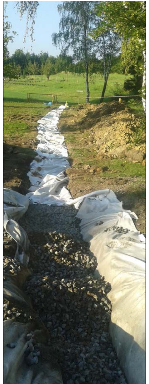
Stavební úpravy rekonstrukce ZTI a venkovních rozvodů ZŠ Krhová