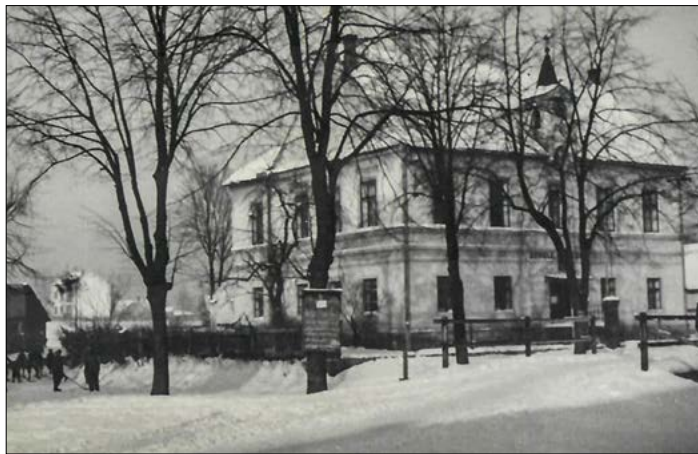
dolní škola za protektorátu

Vedle dvou tříd zde byl i byt pana správce.