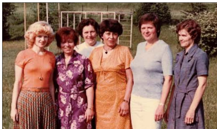
Zaměstnanci školy 1983