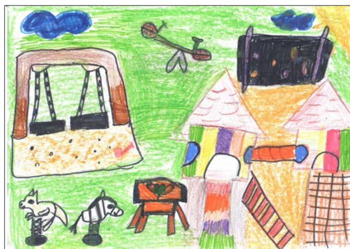
První dětské hřiště v Krhové