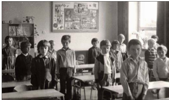
zahájení šk.roku 1982