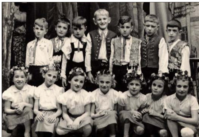
divadlo Kinkáš Martinko