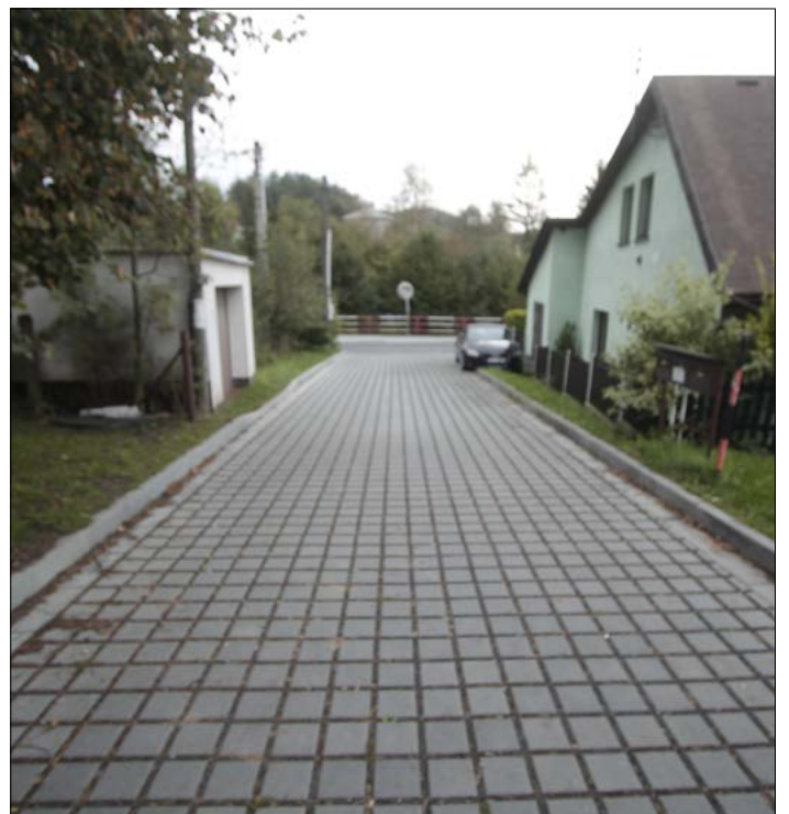
rekonstrukce zpevněných ploch po