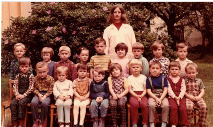
mateřská škola v 1972