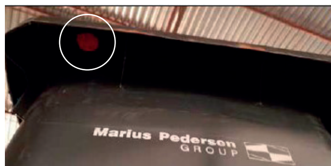
Barevný čip pod popelnicí