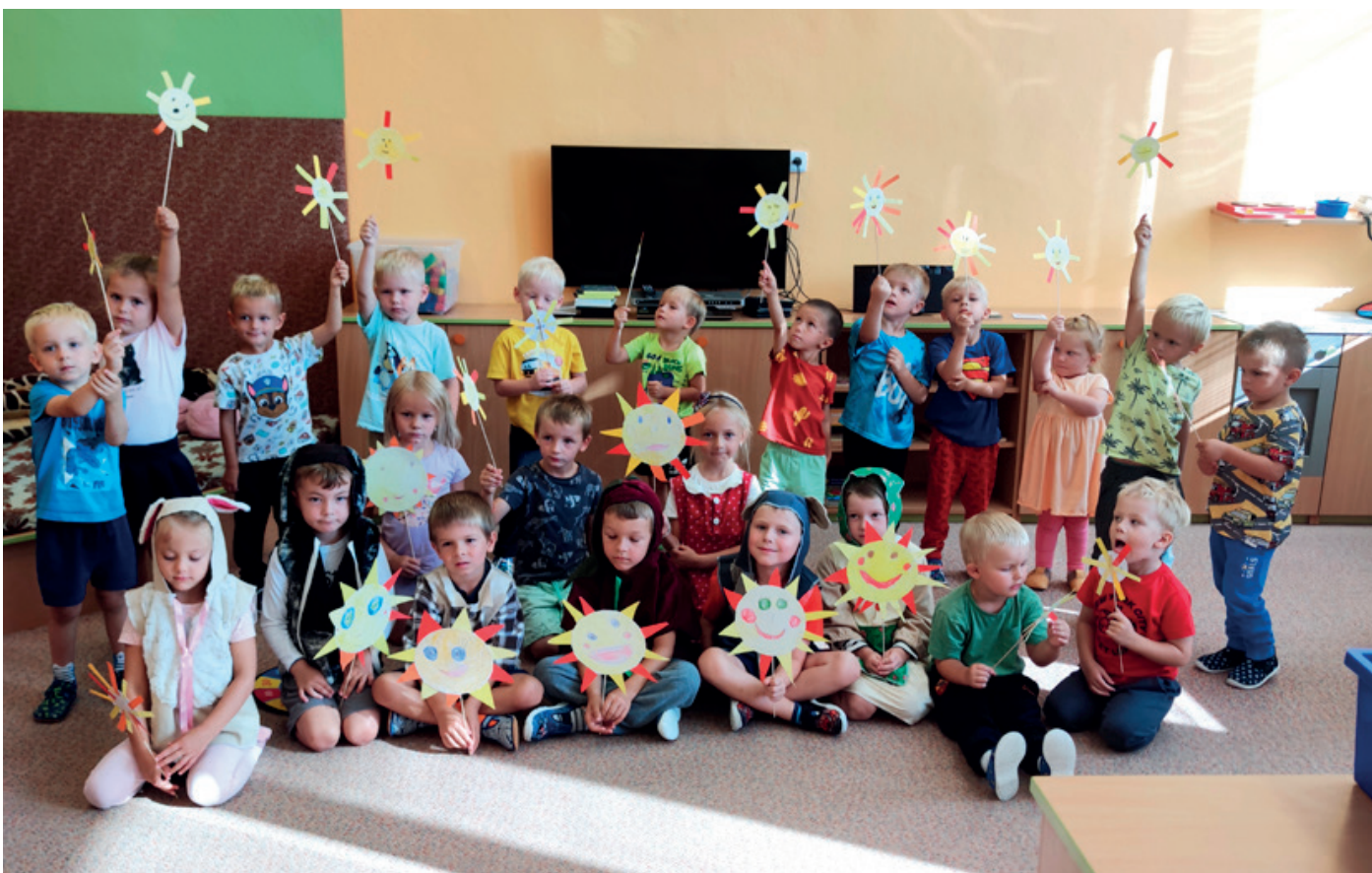
Pozdrav sluníček ze školy