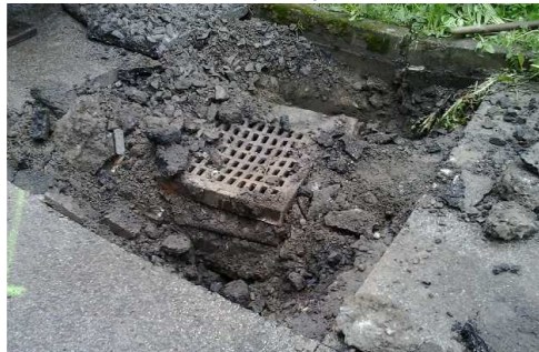
Původní stav dešťové vpusti: